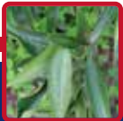
Sintomas de bron- zeamento